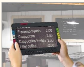
①遠方用カメラ (背面中央)