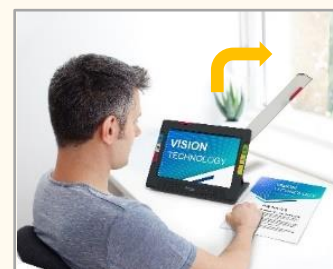
③フルページカメラ (アーム先端)

スタンドを開き、机・テーブル上に置いて使用します。書類の確認や写真を見たりするのに便利です。