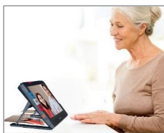
②拡大用カメラ (スタンド内側)

スタンドを開き、机・テーブル上に置いて使用します。書類の確認や写真を見たりするのに便利です。