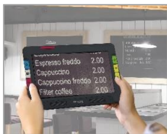
①遠方用カメラ (背面中央)