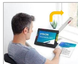
③フルページカメラ (アーム先端)

スタンドを開き、机・テーブル上に置いて使用します。書類の確認や写真を見たりするのに便利です。