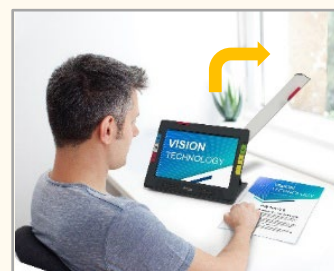
③フルページカメラ (アーム先端)

スタンドを開き、机・テーブル上に置いて使用します。書類の確認や写真を見たりするのに便利です。