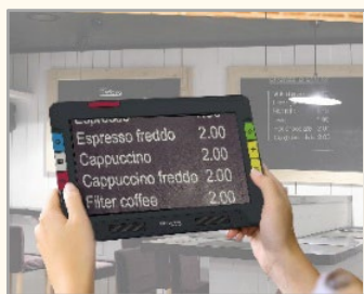
①遠方用カメラ (背面中央)