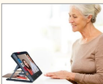
②拡大用カメラ (スタンド内側)

スタンドを開き、机・テーブル上に置いて使用します。書類の確認や写真を見たりするのに便利です。